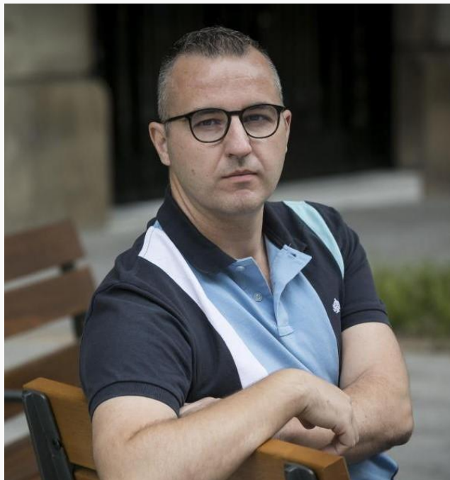
El autor en 2021